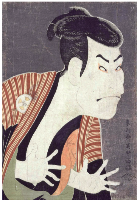
東洲斎写楽 《三代目大谷鬼次の江戸兵衛》 大判錦絵 千葉市美術館蔵