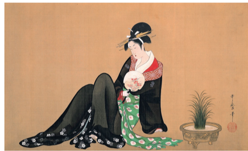
喜多川歌麿 《納涼美人図》 絹本着色一幅 千葉市美術館蔵