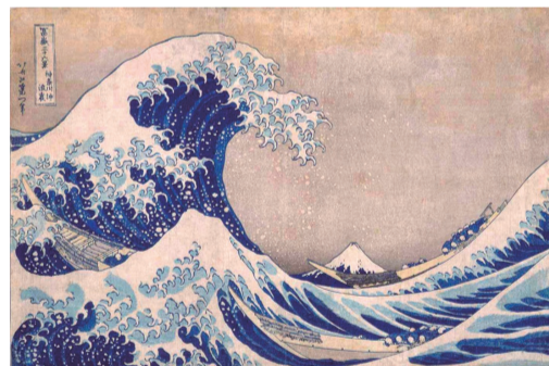
葛飾北斎 《富嶽三十六景 神奈川沖浪裏》 大判錦絵 千葉市美術館蔵

千葉市美術館では、所蔵作品のデジタル画像化、データベースの整備を行い、自宅など様々な場所から検索・鑑賞が可能になります。