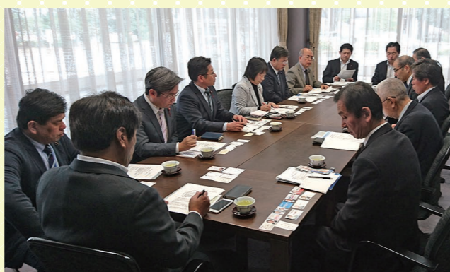
千葉県社会労務士会との意見交換

自治体における指定管理者等において、労働法令の遵守や雇用・労働条件の適切な配慮が求められています。そのようなことから、県内他市で採用されている社会保険労務士による労働条件審査の導入について、千葉県社会労務士会の皆さんと意見交換を行いました。