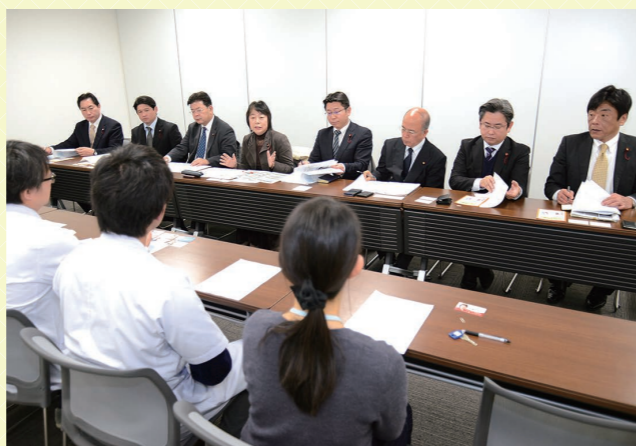
千葉市認知症疾患医療センターとの意見交換

市議団として、千葉大学医学部附属病院に開設されている千葉市認知症疾患医療センターで、医師や臨床心理士の方々と意見交換を行いました。10年後、20年後の未来を見据えた認知症の人を支える街づくりが必要と、小・中学生を対象に、認知症を正しく理解するためのワークショップなどを行う「千葉市認知症こどもカプロジェクト」の取り組みについての説明をいただきました。広く一般の市民が参画する認知症対策の必要性を伺い、今後の施策展開の参考とさせていただきました。