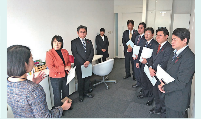
インキュベート施設に入居する事業者との意見交換