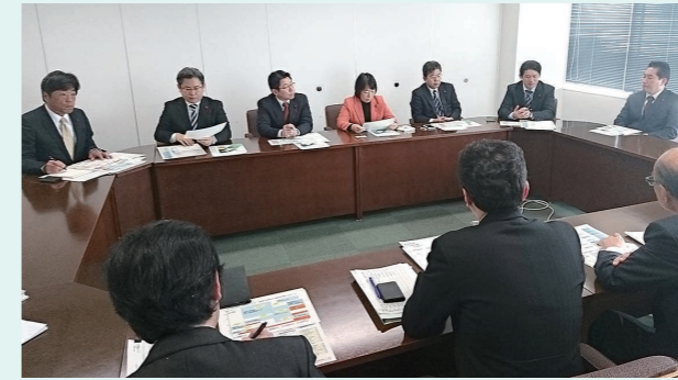
産業振興財団の取組を調査

今議会の代表質問では、産業振興財団の体制強化の現況と今後の取り組みについて伺い、更なる各支援機関との連携強化を求めました。副市長から「財団の支援機能をより一層強化していくとともに、地域企業が利用しやすい情報発信に努めていく」旨の答弁がありました。